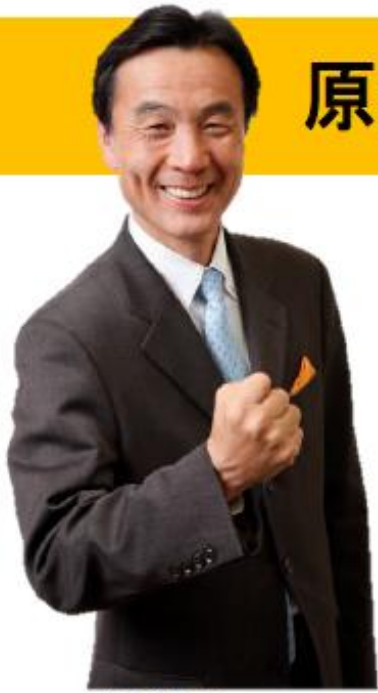
総支部長 水戸まさし (衆議院議員)

我が国において、平成24年7月に固定価格買取(FIT)制度が誕生して以来、急速に再生可能エネルギー利用が広がっています。既に設置完了して稼働している発電施設の発電量が、約3000万kW。一方、契約はしているものの、未だ設置に至っていない発電予定施設が、8700万kWです。