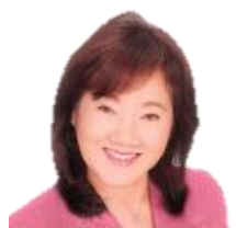
副幹事長 そがべ久美子 (戸塚区・県議)