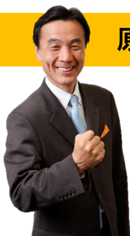
総支部長 水戸まさし (衆議院議員)

ご案内の通り、電気は勝手気ままで、決して一つのところに留まってくれません。今、太陽光や風力といった再生可能エネルギーが脚光を浴びておりますが、これらは天候に左右されますので、かなり不安定なエネルギーです。一方、せっかく発電しても、電力需要が少なければ、無駄に放電せざるを得ないのが実情です。